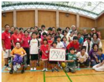
バリアフリーテニス大会