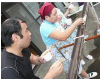
むつみにて手打ちうどん流し