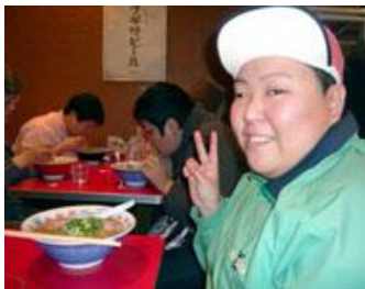
新横浜ラーメン博物館へ