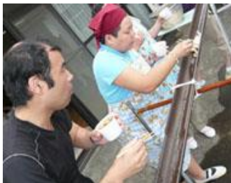
むつみにて手打ちうどん流し