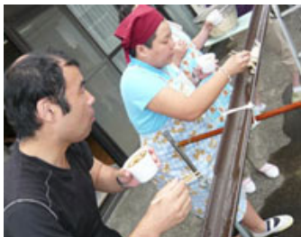
むつみにて手打ちうどん流し