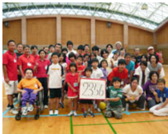
チャレンジテニス大会