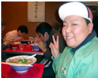
新横浜ラーメン博物館へ