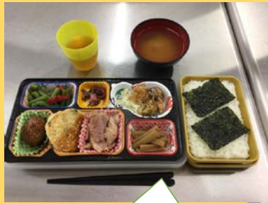
これはいつものお弁当

2020年10月23日発行 発行者：地域活動支援センターぽれぽれ 横浜市南区永田南1-5-3 TEL/FAX (045) 711-0067