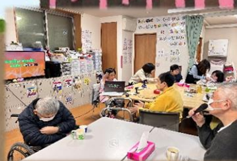
締めはカラオケ大会