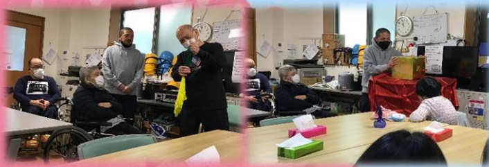
職員によるマジックショー