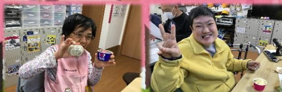
デザートはサーティワンの アイスクリーム