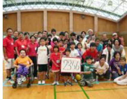
チャレンジテニス大会