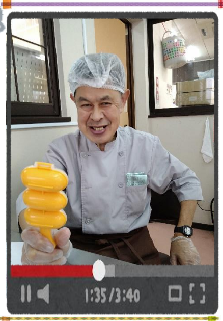
久しぶりのすみれ作業は楽しいよ!