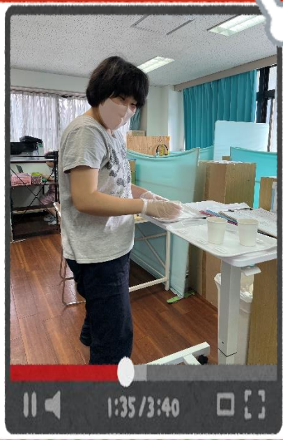
みんなにお茶をお届け。水分大事!