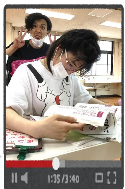
大人になっても勉強を欠かさない。後ろの人にも見習って欲しいですね