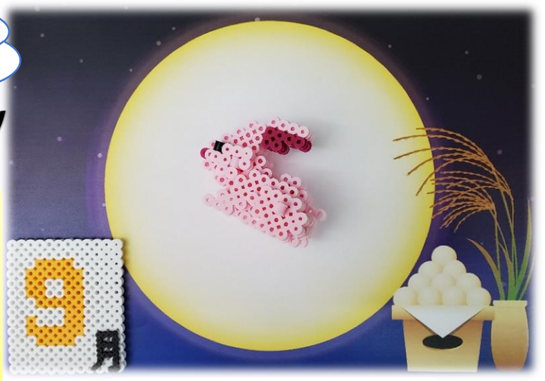
利用者作品 (アイロンビーズ)