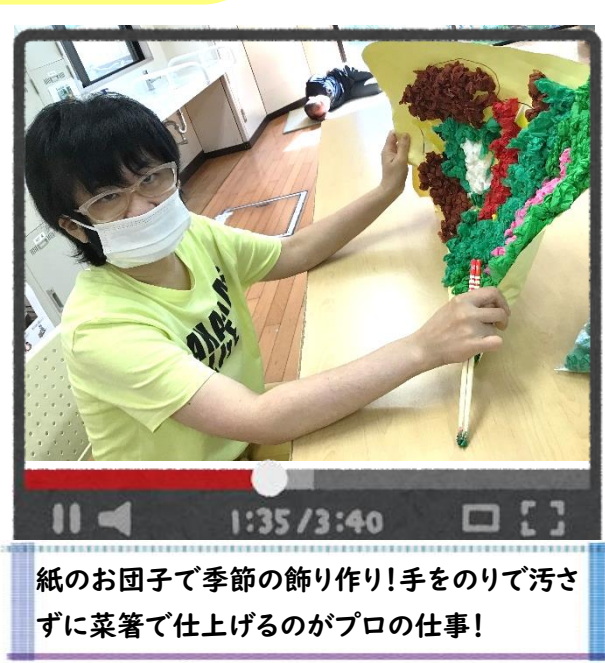
紙のお団子で季節の飾り作り!手をのりで汚さずに菜箸で仕上げるのがプロの仕事!