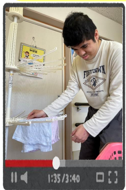
洗濯干しのお手伝いをしてくれています。毎日ありがとうございます。