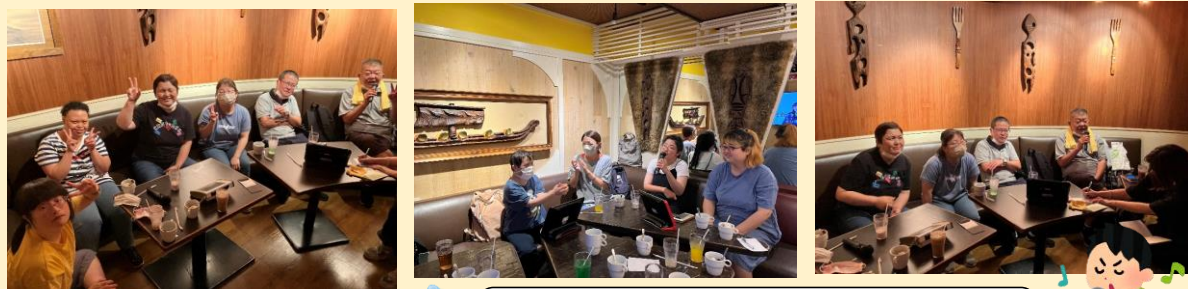
8/7(水) 上大岡ランチ&カラオケ行事

2024年8月21日発行 発行者：地域活動支援センターぽれぽれ 横浜市南区永田南1-5-3 TEL (045) 711-0067 FAX (045) 308-7235