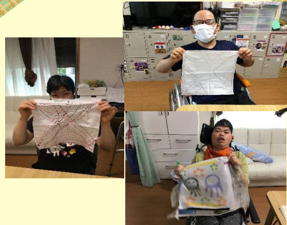
さしこ・ステンシルふきん作り